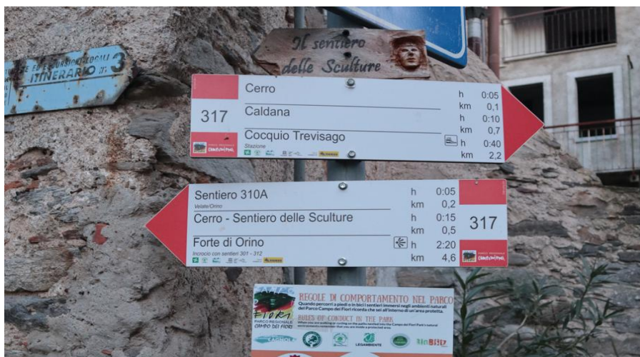
Segnavia dal parcheggio di Cerro